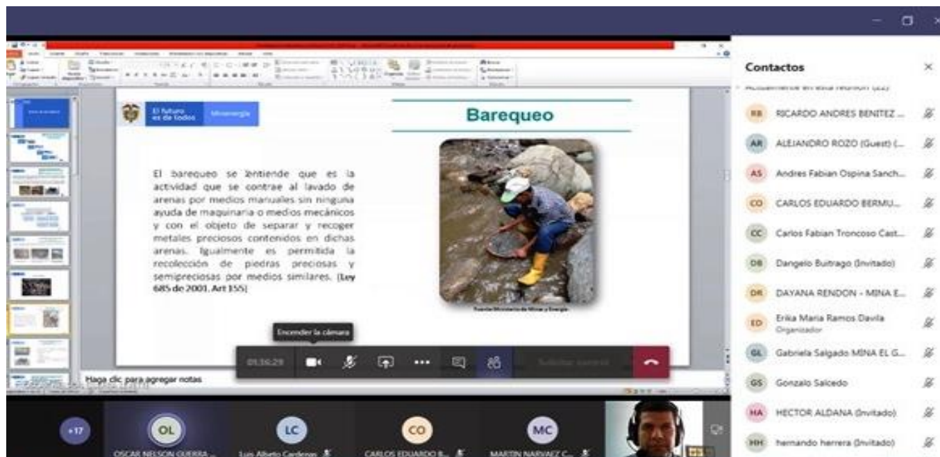
Proceso de formación y asistencia técnica a mineros de subsistencia del Departamento del Tolima